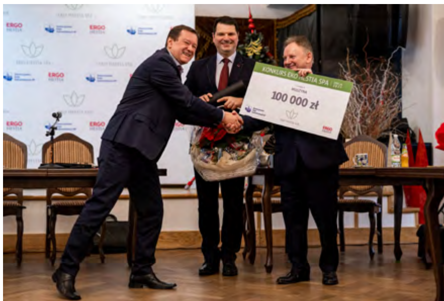
EKO HESTIA SPA