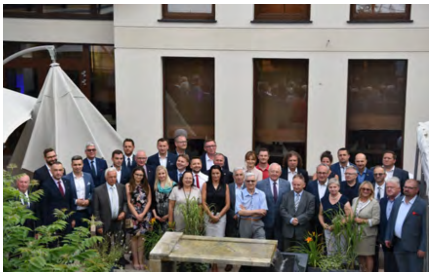
Uczestnicy Walnego Zebrania SGU RP w Ciechocinku