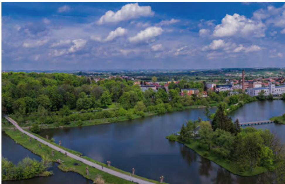
Kazimierza Wielka z lotu ptaka

udokumentowanych zasobów wód siarczanych na terenie województwa świętokrzyskiego wody z Cudzynowic mają najwyższą temperaturę i charakteryzują się największymi zasobami eksploatacyjnymi.