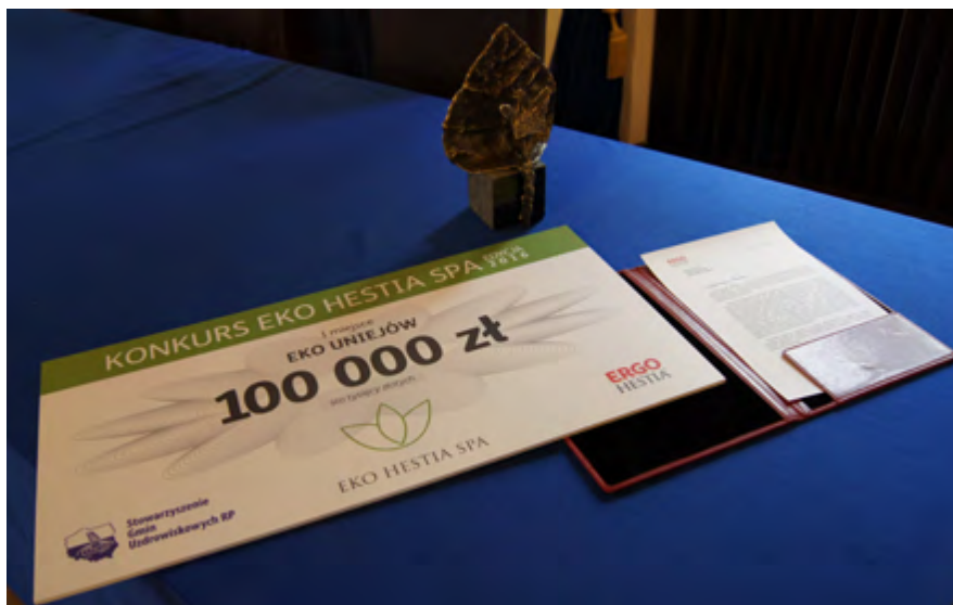
Uniejów - Laureat I edycji konkursu EKO HESTIA SPA

które polskie gminy uzdrowskowe realizowały przez kolejne 5 ostatnich lat. W sześciu dotychczasowych edycjach konkursu uczestniczyło łącznie 38 polskich uzdrowisk.