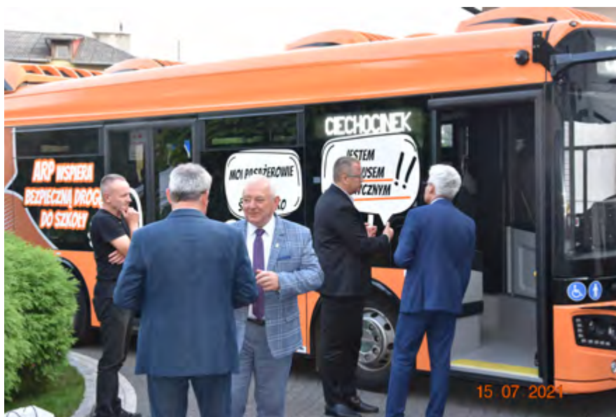
Autobus elektryczny Pilea