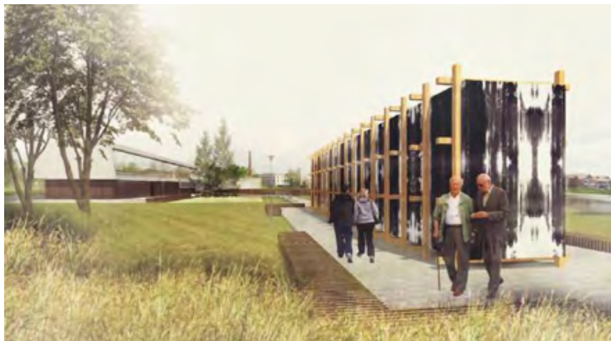
Wizualizacja tężni solankowej

Ze względu na walory widokowe, ścieżka będzie doskonale nadawać się na niedzielne wypady za miasto, szczególnie w okresie letnim, jak również w jesienne, ciepłe i suche dni. Na całej długości ścieżki znajdą się informacje dotyczące fauny i flory ziemi kazimierskiej.