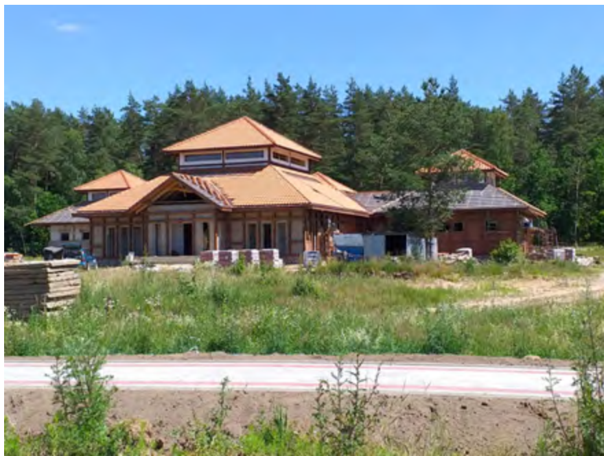
Pawilon uzdrowskiowy w trakcie budowy.

z plemienia Natangów. Ich najwybitniejszym przedstawicielem był Herkus Monte – wódz II powstania pruskiego przeciwko Zakonowi Krzyżackiemu, pierwowzór mickiewiczowskiego Konrada Wallenroda. Powstanie rozpoczęło się w 1260 r. i trwało 14 lat, aż do śmierci bohaterskiego natangijczyka. Dalsze dzieje Natangii to władztwo Krzyżaków (Prusy Zakonne), następnie sekularyzacja zakonu po Hołdzie Pruskim w 1525 r. (Prusy Książęce), a później Królestwo Prus, z którego docelowo wyłoniły się Prusy Wschodnie (Ostpreußen). W okresie wojen napoleońskich na terenach tych odcisnęła swoje piętno sam „bóg wojny”: najpierw jego wojska starty