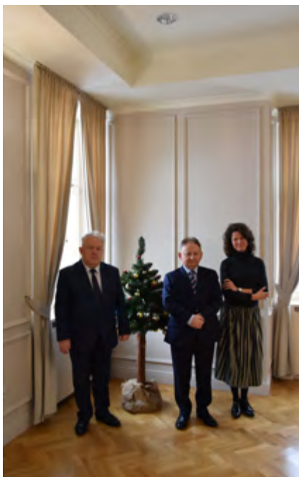
Posiedzenie zarządu SGU RP w Muszynie

nagrody głównej w konkursie jest ERGO Hestia. Dotychczasowi laureaci to: Uniejów, Busko-Zdrój, Inowrocław, Łądek-Zdrój oraz Dębica (uzdrowisko Latoszyn-Zdrój). Konkurs jest organizowany przez Grupę ERGO Hestia (również fundatora nagrody) oraz Stowarzyszenie Gmin Uzdrowiskowych RP. Zwycięzca może przeznaczyć nagrodę finansową wyłącznie na kolejne inwestycje i działania, związane z ochroną środowiska. Do tej pory przeznaczono już łącznie na ten cel 600 000 zł.