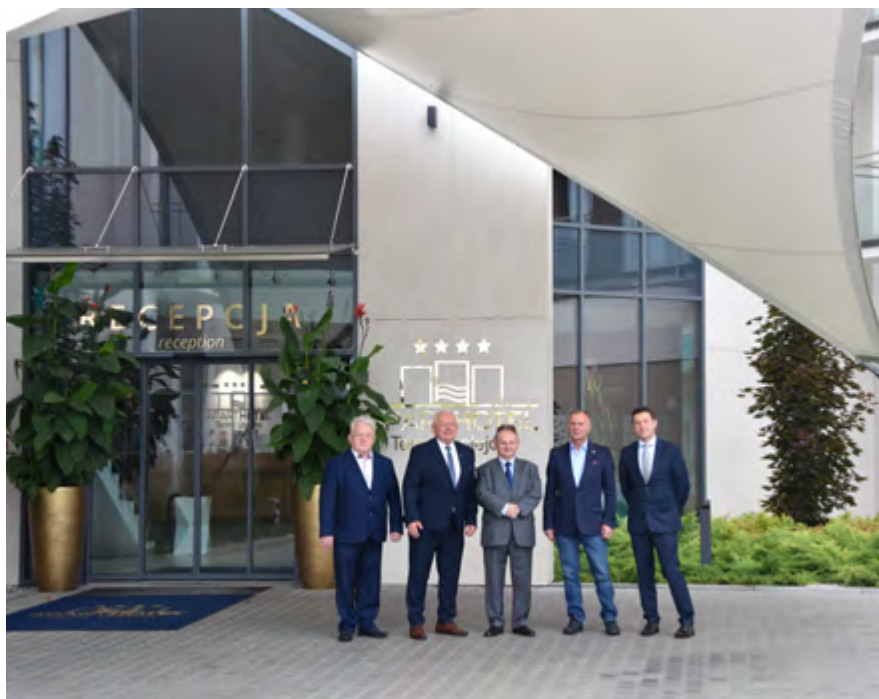
Posiedzenie zarządu w Uniejowie

deklaracjami, tj. bez zachowania średnich kwot wsparcia wyliczonych podczas walnego zebrania. Pozwoli to na efektywne wykorzystanie środków programu i uzyskanie zakładanego w programie efektu ekologicznego w gminach.