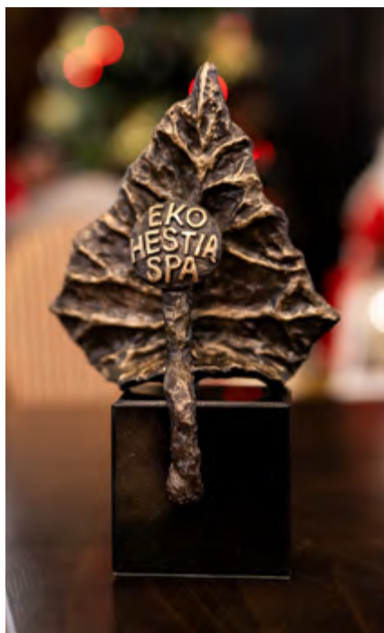
Statuetka konkursu EKO HESTIA SPA

- Polskie uzdrowiska często są lokalnymi liderami w zakresie edukacji ekologicznej i źródłem najciekawszych pomysłów oraz nowoczesnych inwestycji, związanych