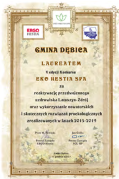
Gmina Dębica - Laureat V edycji konkursu

Głównym laureatem IV edycji (2019) został Łądek-Zdrój, nagrodzony za konsekwentną realizację kompleksowej polityki ochrony środowiska w oparciu o odnawialne źródła energii oraz złoża geotermalne. Jubileuszowa, V edycja w roku 2020 przyniosła zwycięstwo gminy Dębica, która po 75 latach reaktywowała uzdrowisko Latoszyn-Zdrój. Bezkonkurencyjnym zwycięzcą ostatniej edycji okazała się małopolska Muszyna, nagrodzona m.in. za wprowadzenie nowoczesnego systemu zagospodarowania odpadów.