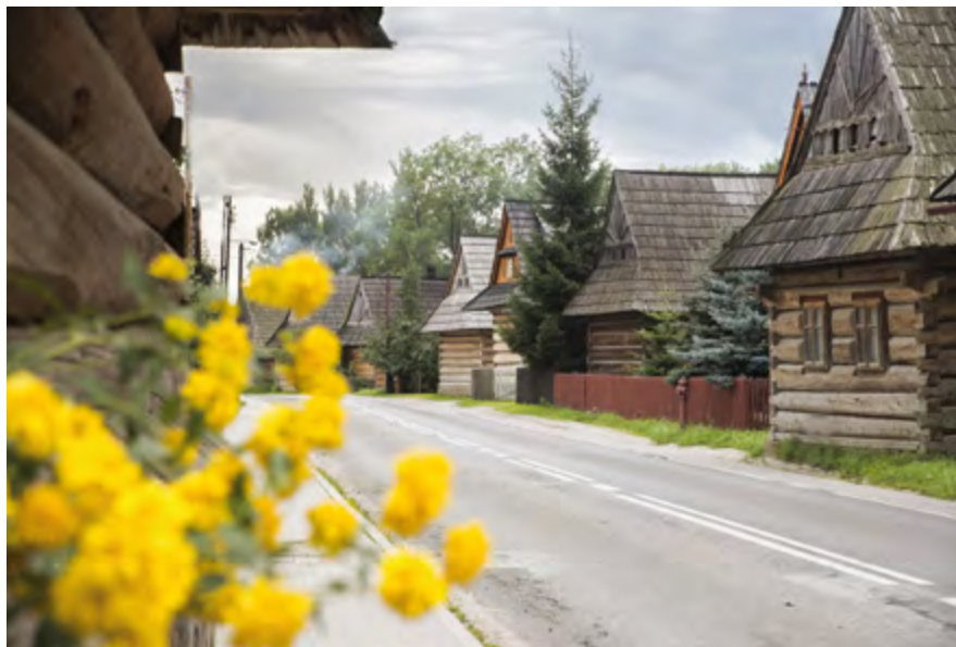
Zabytkowa architektura Chochołowa

Na terenie gminy znajduje się również wiele obiektów infrastruktury