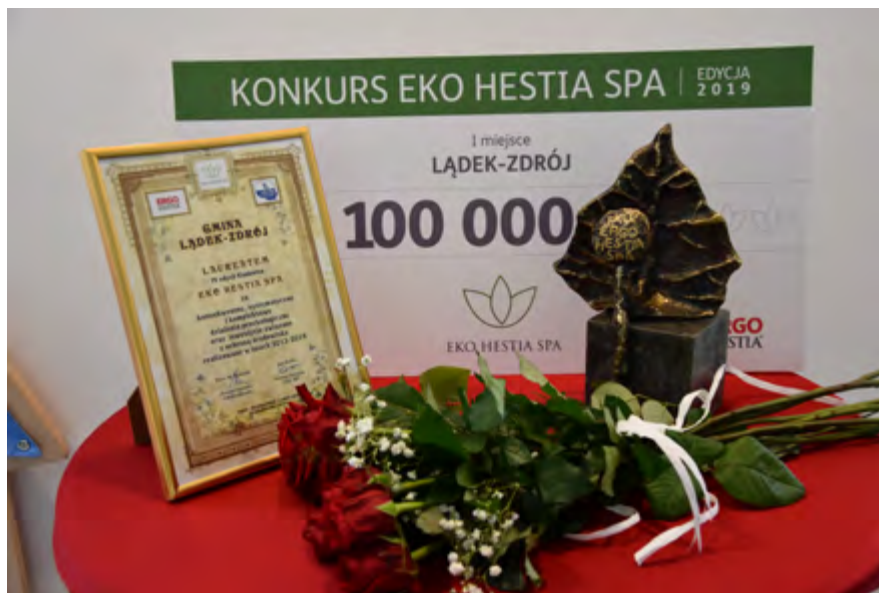
Łądek Zdrój - Laureat IV edycji konkursu

Głównym laureatem IV edycji (2019) został Łądek-Zdrój, nagrodzony za konsekwentną realizację kompleksowej polityki ochrony środowiska w oparciu o odnawialne źródła energii oraz złoża geotermalne. Jubileuszowa, V edycja w roku 2020 przyniosła zwycięstwo gminy Dębica, która po 75 latach reaktywowała uzdrowisko Latoszyn-Zdrój. Bezkonkurencyjnym zwycięzcą ostatniej edycji okazała się małopolska Muszyna, nagrodzona m.in. za wprowadzenie nowoczesnego systemu zagospodarowania odpadów.