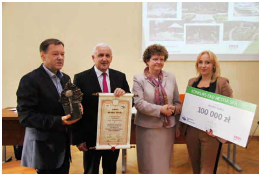
Busko Zdrój - Laureat II edycji konkursu EKO HESTIA SPA