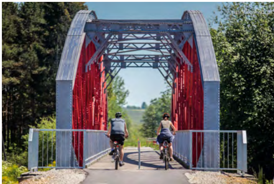
Ścieżka rowerowa

unikatowych na skalę Polski. Szczególnym przykładem jest cietrzew, którego populacja na tych terenach jest jedną z najliczniejszych w Polsce.