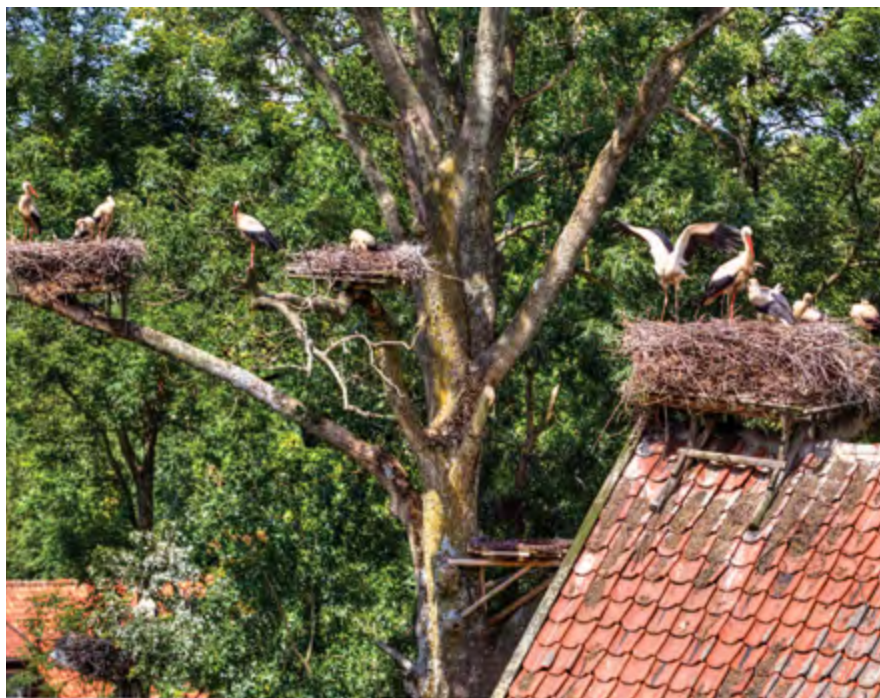
Bociania Wieś Żywkowo, fot. Archiwum Gminy Górowo Iławeckie

powstają tam obiekty lecznicze: zakład przyrodolecniczy z basenem i infrastrukturą techniczną; pawilon uzdrowiskowy z pijalnią wód i salami do hydroterapii, masażu i grotą solną; tężnie solankowe z wiatą inhalacyjną. Wybudowana zostanie także ścieżka kinezyterapeutyczna z obiektami towarzyszącymi, siłownia zewnętrzna, a także ścieżki rowerowe. Obiekty te powstają przy finansowym wsparciu funduszy unijnych w ramach Regionalnego Programu Operacyjnego Województwa Warmińsko-Mazurskiego na lata 2014--2020. W planach jest także budowa sanatorium i innych zakładów lecznictwa