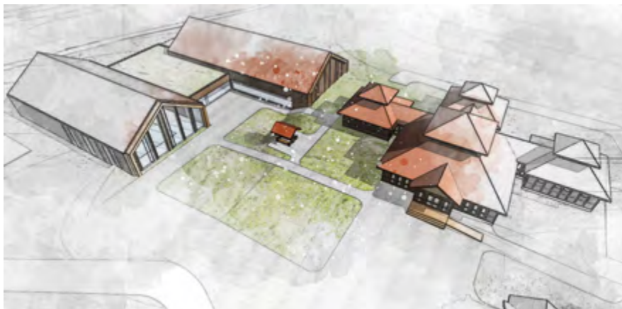
Wizualizacja pawilonu uzdrowskiego i zakładu przyrodoleczniczego

Kierunki lecznicze w powstającym uzdrowsku to choroby ortopedyczno-urazowe, reumatologiczne oraz choroby górnych i dolnych dróg oddechowych. Aktualnie