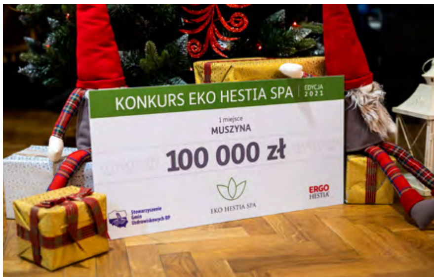
EKO HESTIA SPA