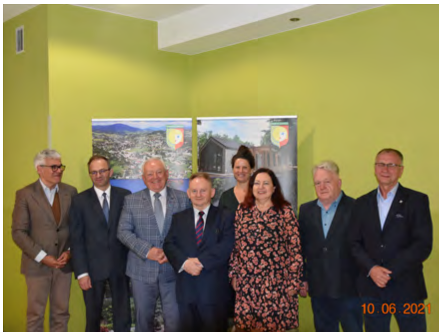
Posiedzenie zarządu w Rabce Zdroju

Miejscem drugiego posiedzenia Zarządu SGU RP było uzdrowisko termalne Uniejów.